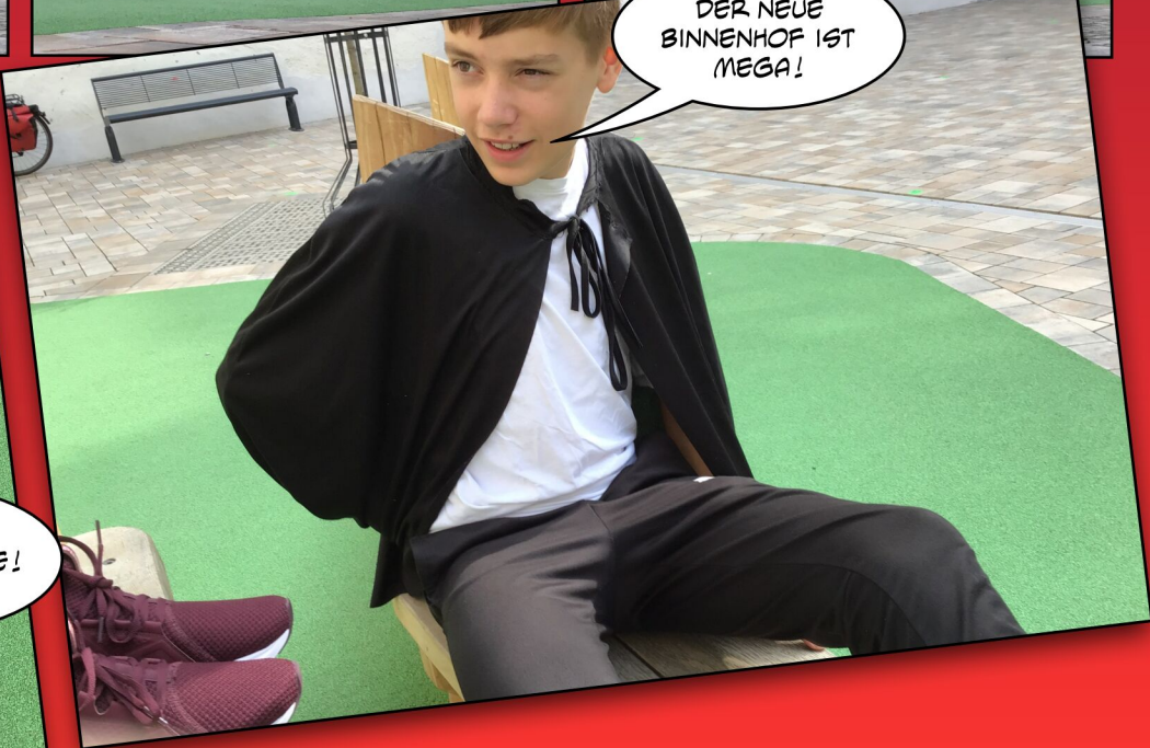
DER NEUE BINNENHOF IST MEGA!