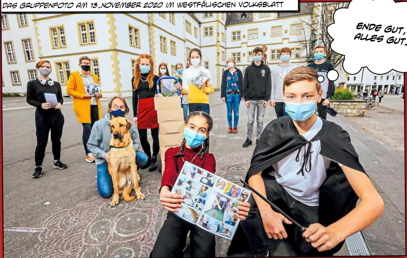
DAS GRUPPENFOTO AM 13. NOVEMBER 2020 IM WESTFÄLISCHEN VOLKSBLATT